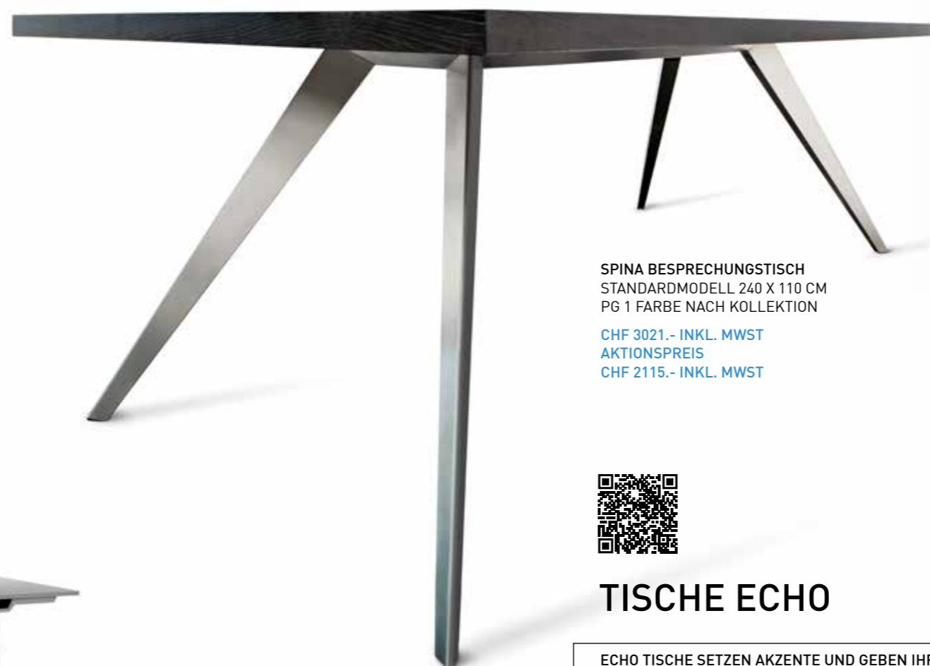
SPINA BESPRECHUNGSTISCH STANDARDMODELL 240 X 110 CM PG 1 FARBE NACH KOLLEKTION

CHF 3021.- INKL. MWST AKTIONSPREIS CHF 2115.- INKL. MWST