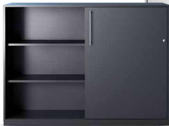
SCHIEBETÜRSCHRANK STANDARDMODELL 160 X 115 X 40 CM PG 1 FARBE NACH KOLLEKTION

CHF 1204.- INKL. MWST AKTIONSPREIS CHF 843.- INKL. MWST