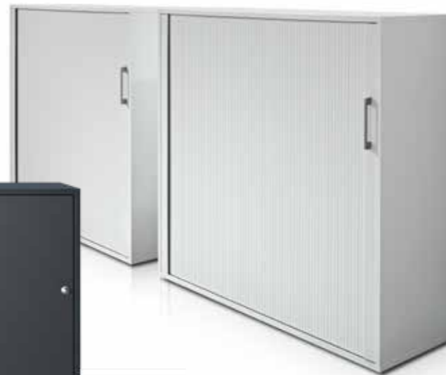
QUERROLLSCHRANK PROGRESSMODELL 120 X 113.1 X 40 CM PG 1 FARBE NACH KOLLEKTION

CHF 1204.- INKL. MWST AKTIONSPREIS CHF 843.- INKL. MWST