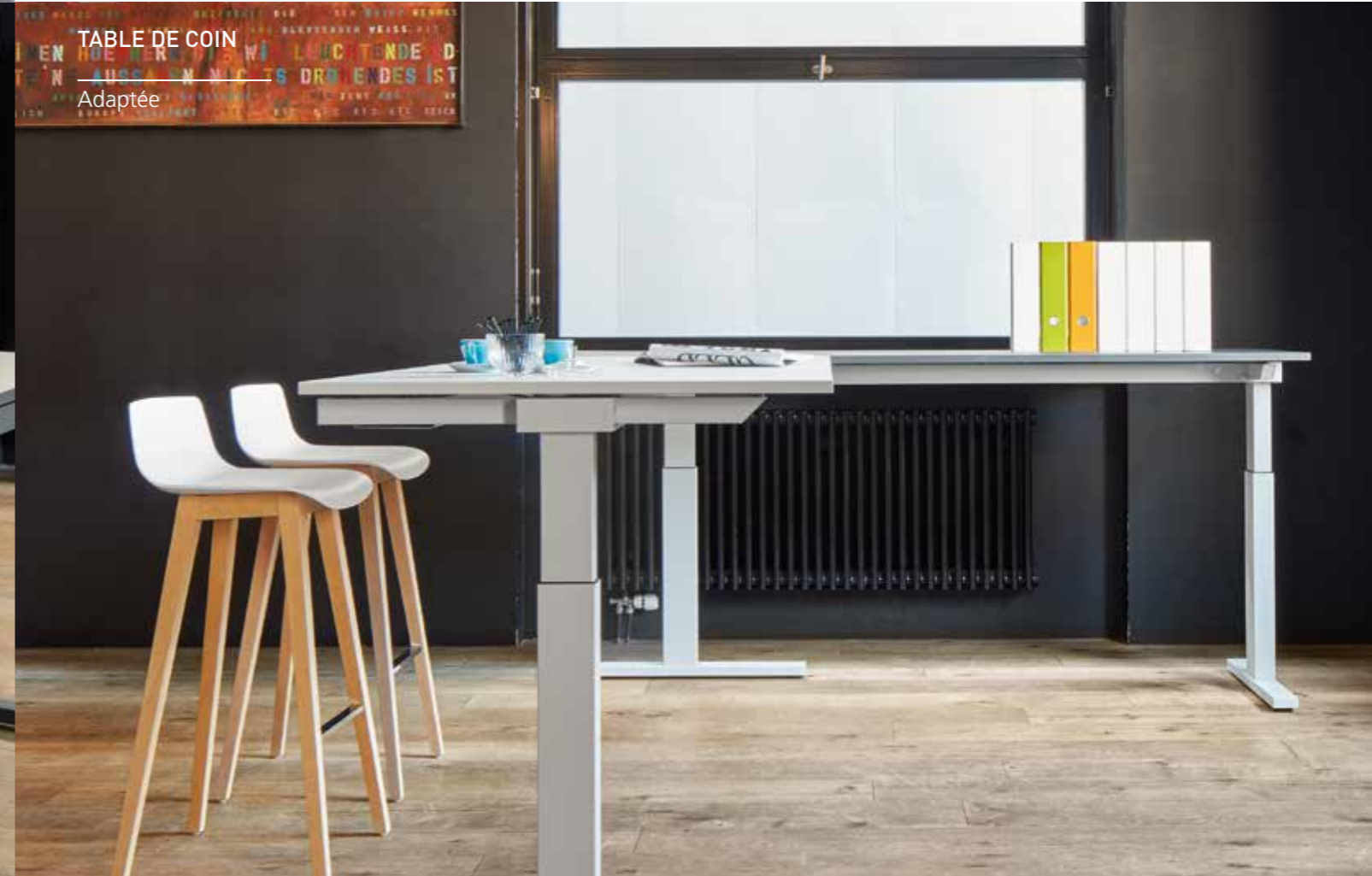
TABLE DE COIN